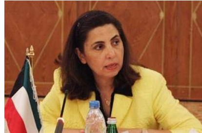
وزيرة الدولة لشؤون التخطيط والتنمية ووزير الدولة لشؤون مجلس أمناء المعهد العربي للتخطيط الدكتورة رولا دشنتي

القاهرة - 6 - 6 (كونا) -- أكدت وزيرة الدولة لشؤون التخطيط والتنمية ووزير الدولة لشؤون مجلس أمناء المعهد العربي للتخطيط الدكتورة رولا دشنتي حرص المعهد خلال الفترة المقبلة على توسيع دائرة المستفيدين من الخدمات التدريبية والاستشارية والبحثية التي يقدمها لكل الدول الأعضاء. وذكرت الوزيرة دشنتي في افتتاح الاجتماع الثاني لمجلس أمناء المعهد العربي للتخطيط لعام (2012-2013) هنا اليوم أن المعهد على وعي تام بالتحدي الكبير الذي تواجهه الدول العربية من زيادة الضغوط التنافسية ومن ارتفاع تطلعات المواطنين إلى مستوى أكثر تطوراً لأداء العاملين بالأجهزة الحكومية الفاعلين على تقديم الخدمات التي تلمس حياتهم اليومية.