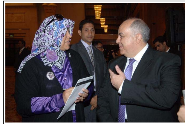
د. عمرو دراج متحدثا للزميلة هناء السيد

وشدد الوزير المصري في تصريح على هامش مشاركته في افتتاح أعمال الاجتماع الثاني لعام 2012 - 2013 لمجلس أمناء المعهد العربي للتخطيط على أن المعهد يضم كفاءات وخبرات متميزة للغاية في مختلف المجالات العلمية والبحثية والتدريبية.