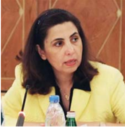
رولا دشتي في اجتماع أمناء التخطيط

القاهرة - كونا - أكدت وزيرة الدولة لشؤون التخطيط والتنمية وزيرة الدولة لشؤون مجلس الأمة رئيسة مجلس أمناء المعهد العربي للتخطيط الدكتورة رولا دشتي أمس، ان تحقيق هدف الرخاء الاجتماعي وسياساته يستحوذ على حيز ملحوظ من اهتمام الحكومة.